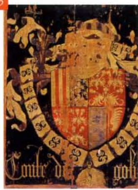
GUILLAUME SPICRE ET ADAM DUMONT

à gauche : Panneau aux armes d'Antoine, Grand Bâtard de Bourgogne, vers 1460 à droite : Panneau aux armes de Pierre de Cardone, vers 1460