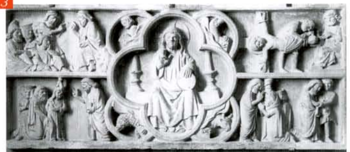
BOURGOGNE, XIII e SIÈCLE Devant d'autel : L'Apostolat de saint Pierre

En 1432, Philippe le Bon choisit la Sainte-Chapelle de Dijon comme « lieu, chapitre et collège » de l'Ordre de la Toison d'Or qu'il avait créé lors de son mariage avec Isabelle de Portugal, en 1430. Le duc fonda alors une messe solennelle et quotidienne, qui ne cessa d'être dite jusqu'en 1789, et porta le nombre des chanoines à vingt-quatre comme celui des chevaliers.