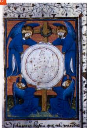
La Sainte-Hostie, enluminure des Heures de René d'Anjou, 2 e quart du XV e siècle

Des panneaux peints avec les armoiries de ces derniers furent disposés au-dessus des stalles du chœur. Lors des chapitres, les armoiries des chevaliers décédés devaient être retirées, transférées dans la nef et remplacées par celles des nouveaux promus. En 1460, Guillaume Spicre et Adam Dumont, peintres de la cour de Bourgogne, reçurent une commande de dix-neuf panneaux armoriés. De ce décor, disparu à la Révolution, ne subsistent que deux panneaux incomplets, qui ont été retrouvés remontés dans un meuble (fig. 4 et 5).