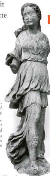
BOURGOGNE, DERNIER QUART DU XVI e SIÈCLE La Renommée, statue provenant du tombeau de Gaspard de Saulx-Tavannes