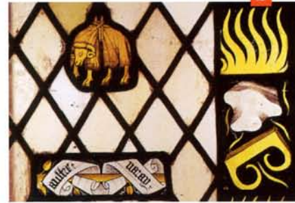
BOURGOGNE, MILIEU DU XV e SIÈCLE Fragments de vitraux : la toison d'or, insigne de l'ordre, une banderole avec la devise de Philippe le Bon « Aultre n'aray », fusils, pierres et étincelles (remontage postérieur)

et 1454 : les quelques fragments remontés dans les baies de la salle du Chapitre passent pour en provenir (fig. 2). Les tours de la façade furent élevées de 1495 à 1515, et la dédicace n'eut lieu qu'en 1500.