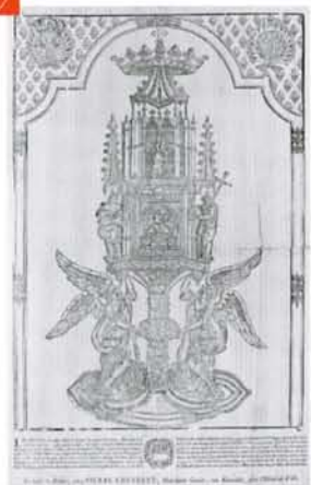
Le reliquaire de la Sainte-Hostie, gravure de la fin du XVII e siècle