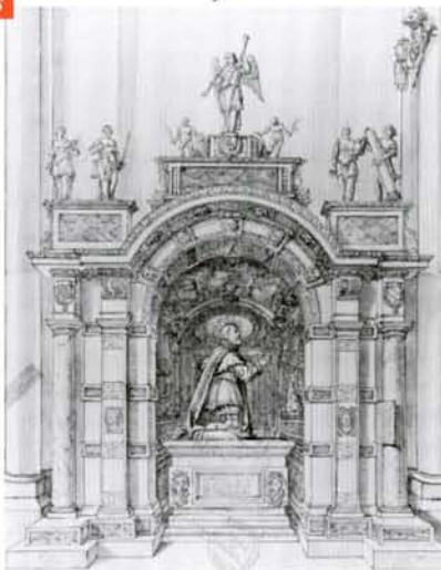
Tombeau de Gaspard de Saulx-Tavannes († 1573), dessin du XVII e siècle

Aux XV e et XVI e siècles, le nombre des chapelles ouvertes sur les collatéraux ou disposées contre les piliers de la nef et du transept s'accrut. La plus riche était celle fondée par Girard de Vienne en 1521. De cette