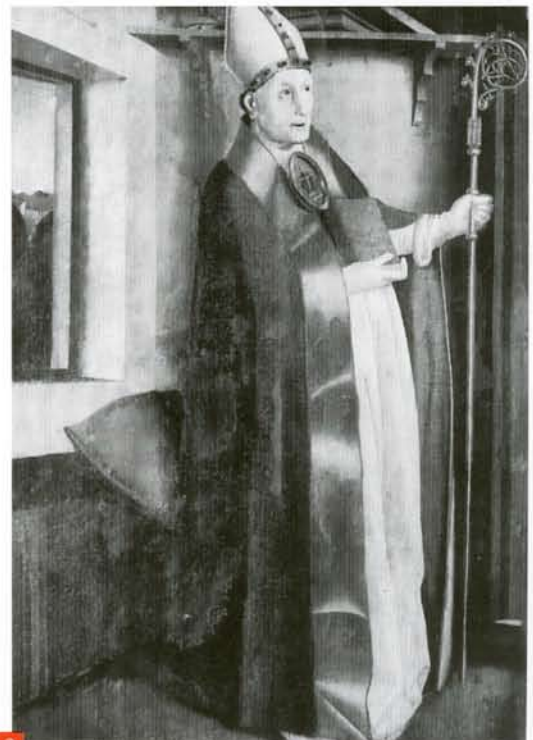
KONRAD WITZ, Saint Augustin

Sur le retable, les représentations peintes sur les volets étaient donc mises en correspondance avec des scènes du panneau central, probablement sculpté. C'est ainsi que, selon la dernière reconstitution