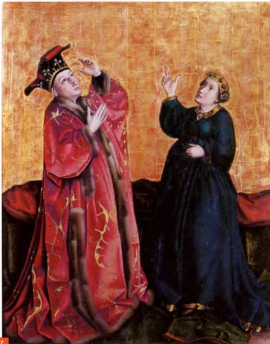
KONRAD WITZ (ROTTWEIL, AVANT 1400 - BÂLE, 1447), L'Empereur Auguste et la sibylle de Tibur