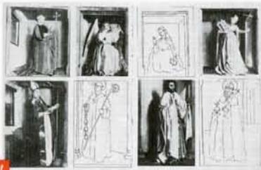
Reconstitution du retable fermé, d'après Michaël Schauder

Mais Witz est aussi influencé par les innovations apportées par les peintres flamands. Il les rejoint par son souci de représenter des volumes dans un espace défini par la lumière, par son attention à la représentation attentive et raffinée de la matière, sensible ici dans le rendu des tissus et de l'orfèvrerie. Les volets extérieurs du Retable de l'Agneau mystique de Jan van Eyck à Gand (fig. 5) ont à l'évidence servi de modèle pour l'extérieur des volets. On y retrouve des figures monumentales dans un espace architectural neutre mais ouvert sur l'extérieur, et décrit de façon réaliste.