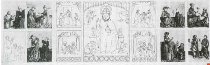
Reconstitution du retable ouvert, d'après Michaël Schauder

proposée (fig. 3), l'Empereur Auguste et la Sibylle de Tibur (Dijon) devaient être en relation avec la Nativité : l'épisode, qui fait référence à l'histoire de Rome, manifeste que le monde païen a eu, comme le monde juif, part à l'annonce de la venue du Christ. Sur les autres panneaux,