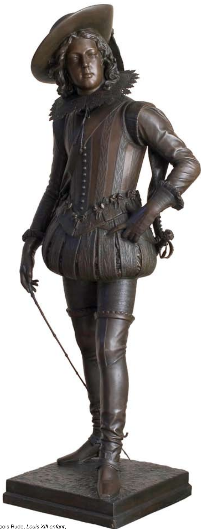
François Rude, Louis XIII enfant , version de 1878, bronze. Dijon, musée des beaux-arts.

En 2007, grâce à la générosité de APRR, (Autoroutes Paris-Rhin-Rhône) une statue de François Rude, Louis XIII enfant entre au musée des beaux-arts de Dijon.