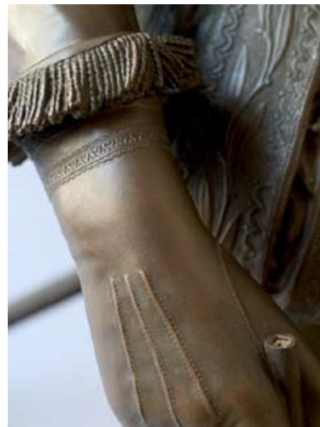
Fig. 6 : détail du gant : imitation des piqûres

l'Exposition Universelle de 1878, où elle attira l'attention de Théophile Gauthier. Ce second tirage réalisé en bronze à la demande de la famille propriétaire du premier tirage en argent, à une époque où possession physique vaut possession des droits d'auteurs, doit être considéré comme une oeuvre originale.