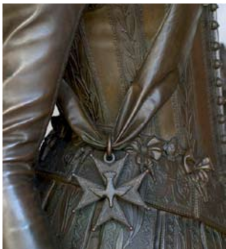
Fig. 4 : Détail du costume de Louis XIII

à Versailles, que le duc fait appel à François Rude. Par une lettre du 6 décembre 1840, Rude s'engage auprès de Duban à faire le modèle en plâtre, grandeur nature, pour 10 000 francs. En 1842, le plâtre original est transmis aux fondeurs Richard, Eck et Durand qui réaliseront la fonte en argent pour 12 000 francs, pour le 1er janvier 1843. Rude donnera ensuite le projet du socle, qui sera