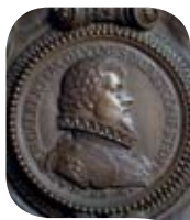
Louis XIII enfant par François Rude