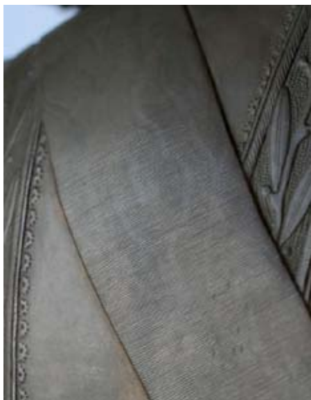
Fig. 8 : détail du cordon du collier du Saint-Esprit : effet de moiré.

La statue de bronze a quitté la France peu avant la Seconde Guerre Mondiale. Alors que la statue d'argent a été volée, on mesure l'importance de la réapparition et du retour en France, dans une collection publique, de cette deuxième et probablement désormais unique version du Louis XIII de François Rude.