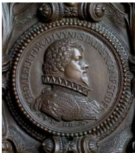
Fig. 5 : Le connétable Charles d'Albert de Luynes

Pour imaginer son personnage, Rude s'est inspiré d'une gravure de 1618, représentant Louis XIII prenant une leçon d'équitation. Il campe le jeune roi en marche, la cravache en main, vêtu d'un élégant costume dont tous les détails sont rendus avec autant d'exactitude que de plaisir (fig. 4 et 6). Le socle est orné de quatre génies portant les attributs royaux : couronne, casque, épée et sceptre, Rude reprend aussi, face et revers, une médaille (fig. 5) frappée