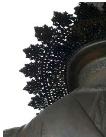
Fig. 7 : détail du col : effet de dentelle à l'aiguille

Le bronze, une fonte au sable monté à la romaine, est d'une extraordinaire qualité. La virtuosité de Rude (fig. 6) est admirablement servie par celle du fondeur (fig. 7) et du ciseleur, Cauchois (fig. 8).