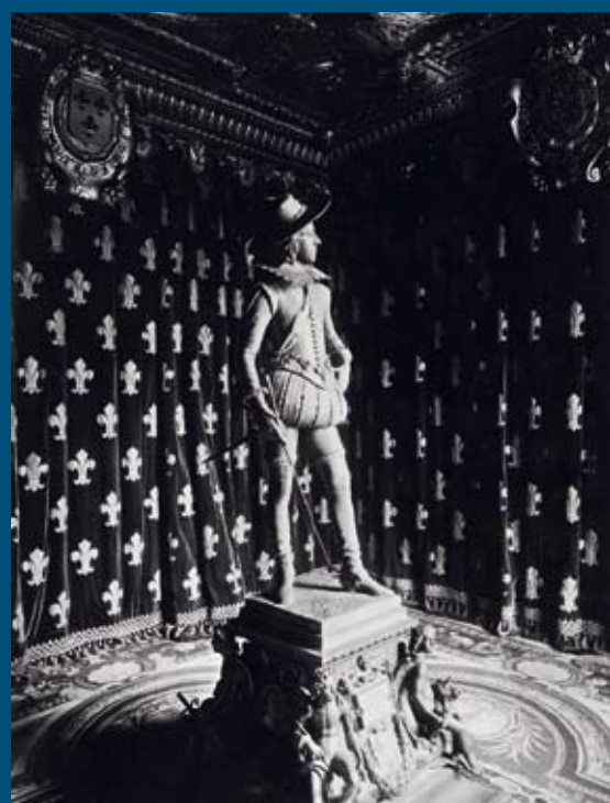
Fig. 2 : François Rude, Louis XIII enfant , version de 1843 en argent, dans la salle Louis XIII au château de Dampierre. Documentation du musée des beaux-arts de Dijon.

Le duc Honoré de Luynes (1802-1867), passionné d'histoire et d'art, décide en 1838 de rénover son château de Dampierre (Yvelines). Il veut y honorer Louis XIII, à l'origine de la fortune de sa famille après que son ancêtre, le connétable Charles d'Albert de Luynes (1578-1621), avait aidé à établir son autorité au début de son règne.