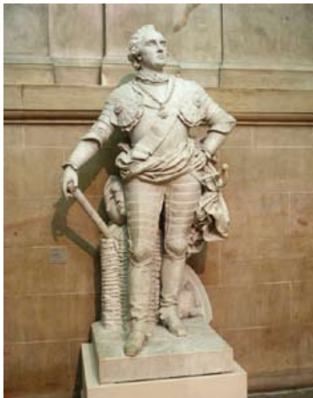
Fig. 3 : François Rude, Le Maréchal de Saxe , 1836, marbre. Dijon, musée des beaux-arts, dépôt du musée du Louvre.

C'est après avoir admiré, au Salon de 1838, la statue du Maréchal de Saxe (fig. 3), commandée en 1836 pour le musée de l'histoire de France