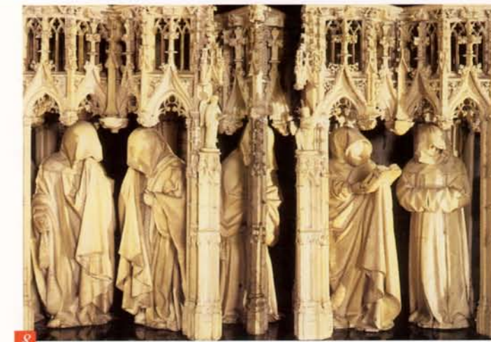
Tombeau de Philippe le Hardi, détail des arcatures

En voyant Marguerite de Bavière, épouse de Jean sans Peur, reposer à ses côtés, on peut s'étonner de l'absence de Marguerite de Flandre aux côtés de Philippe le Hardi. La première duchesse de Bourgogne, comtesse de Flandre et d'Artois, resta fidèle à ses ancêtres et élit sépulture auprès de son père, Louis de Mâle, et de sa mère, Marguerite de Brabant, dans l'église Saint-Pierre de Lille. C'est Philippe le Bon qui fit élever en 1453 un monument sur la tombe de ses ancêtres. Les pleurants, de bronze et non d'albâtre, représentent le lignage de Flandre et de Bourgogne : s'il est le seul de la dynastie à ne pas avoir eu de monument funéraire, Philippe se montra en revanche très sensible à la valeur dynastique de ces tombeaux. Il avait commandé vers 1434 un tombeau à sa première épouse Michelle de France (+ 1422) à l'abbaye Saint-Bavon de Gand, et vers 1436 celui de sa soeur Anne, duchesse de Bedford (+ 1432), dans l'église des Célestins de Paris.