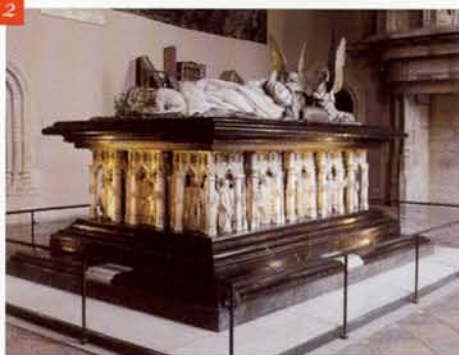
JEAN DE MARVILLE, CLAUS SLUTER, CLAUS DE WERVE ET LEUR ATELIER Tombeau de Philippe le Hardi, 1381-1410

Une longue réalisation. En 1381, Jean de Marville, imagier du duc, est chargé de l'exécution du