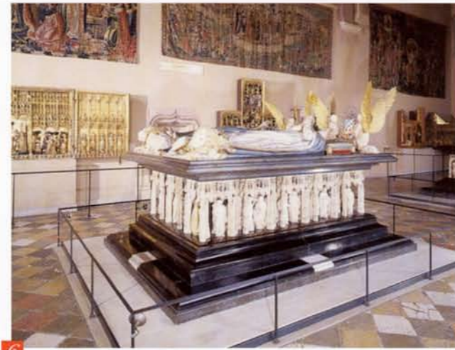
JEAN DE LA HUERTA, ANTOINE LE MOITURIER ET LEUR ATELIER, Tombeau de Jean sans Peur et de Marguerite de Bavière, 1443-1470

suivis des membres de la famille du duc, officiers et gens de sa « maison », tous drapés dans les manteaux de deuils qui étaient effectivement distribués lors des funérailles. Les visages sont caractérisés mais il ne s'agit pas de portraits.