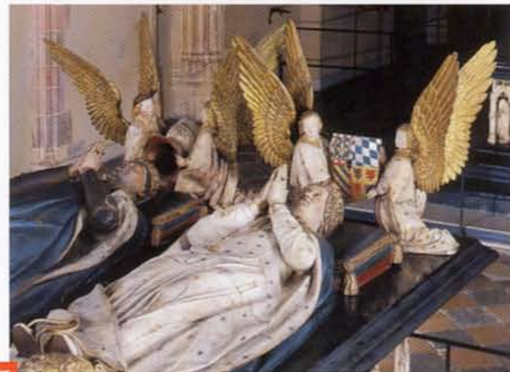
Tombeau de Jean sans Peur, les anges et les gisants