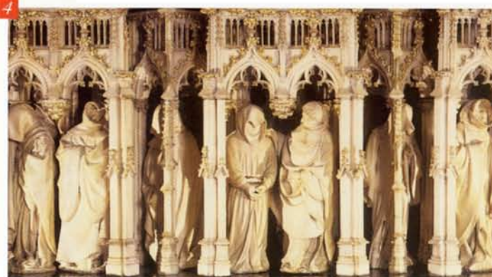
Tombeau de Philippe le Hardi, détail des arcatures

Les arcades sont formées d'une alternance de travées doubles et de niches triangulaires, très finement sculptées. Le marbre blanc, en partie doré à l'origine, contraste avec le noir du marbre de Dinant de la base et de la dalle (fig. 4).