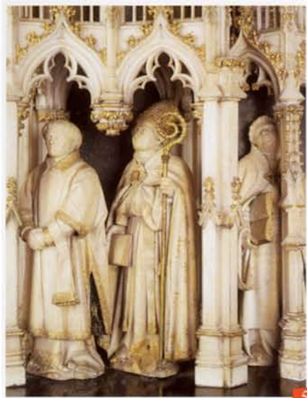
Tombeau de Philippe le Hardi, l'évêque

suivis des membres de la famille du duc, officiers et gens de sa « maison », tous drapés dans les manteaux de deuils qui étaient effectivement distribués lors des funérailles. Les visages sont caractérisés mais il ne s'agit pas de portraits.