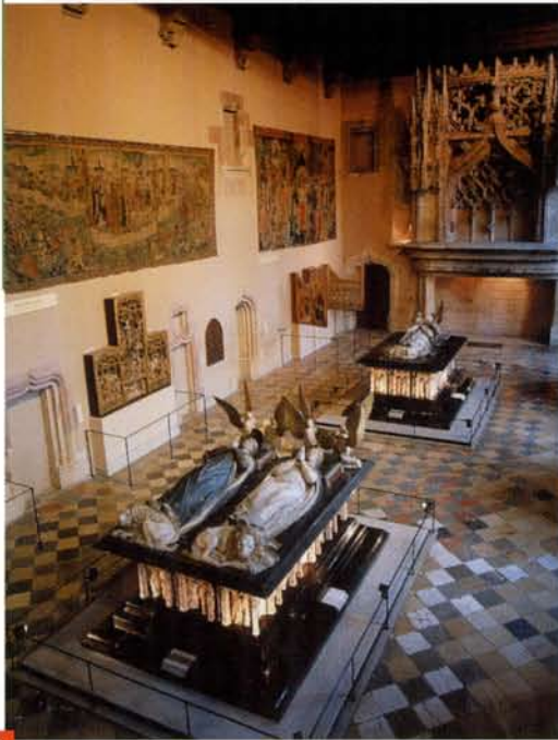
La salle des Gardes en 2004 DIJON, MUSÉE DES BEAUX-ARTS