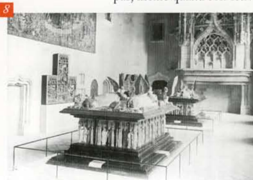
La salle des Gardes en 1945 DIJON, MUSÉE DES BEAUX-ARTS, © MBA DIJON, DOCUMENTATION

La salle est, en quelque sorte, enfin devenue la "salle des Ducs de Bourgogne". Curieusement, ce nom, qui avait été proposé par Févret de Saint-Mémin, ne s'imposa pas, même quand son œuvre fut parachevée par Pierre Quarré, et alors qu'il rendrait mieux compte du contenant et du contenu. Si le nom de "salle des tombeaux" est aussi souvent utilisé, celui "salle des Gardes" reste le plus employé, signe que le palais reste fortement présent dans le musée.