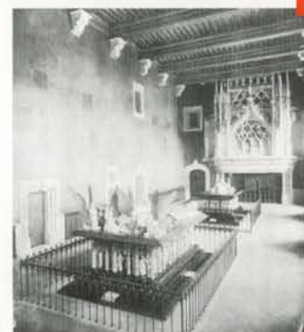
La salle des Gardes en 1900 DIJON, MUSÉE DES BEAUX-ARTS

C'est à l'issue de la guerre, entre 1945 et 1951, que Pierre Quarré, conservateur de 1938 à 1979, mènera à bien la réorganisation du musée. La salle des Gardes qui rouvre en septembre 1945 n'a plus rien à voir avec celle de 1939 (fig. 8). Crépi clair, suppression des boiseries et grilles néogothiques, et surtout sélection d'œuvres uniquement en rapport avec les ducs de Bourgogne. A quelques modifications près, c'est l'aspect qu'elle a toujours aujourd'hui.