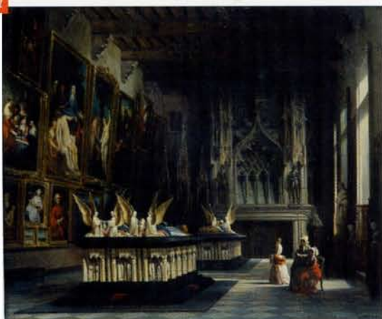
AUGUSTE MATHIEU, La Salle des Gardes au musée de Dijon en 1847 DIJON, MUSÉE DES BEAUX-ARTS

Les archives du musée conservent des photographies qui permettent de retracer l'évolution de l'accrochage au cours du XIX e et du XX e siècle. Sur un cliché de 1894