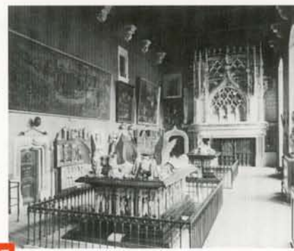
La salle des Gardes après 1901 DIJON, MUSÉE DES BEAUX-ARTS, © MBA DIJON, DOCUMENTATION