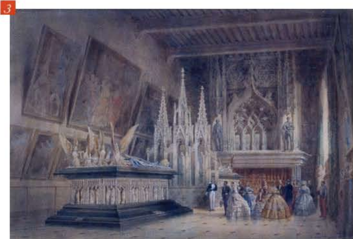
HUBERT CLERGET, Visite de Sa Majesté l'Empereur aux tombeaux des Ducs de Bourgogne à Dijon, 1861 , DIJON, MUSÉE DES BEAUX-ARTS

immortalisant la "visite aux tombeaux" de l'empereur Napoléon III et de l'impératrice Eugénie en 1861 (fig. 3).